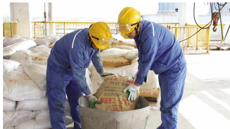
经过一个多月的施工改造,利海化工公司双氧水扩产改造工程于9月19日进入试生产阶段。该项目总投资299万元,具有投资小、工期短、效益显著等特点,双氧水年生产能力将由10万吨扩大到12万吨,年节约总成本300余万元。图为员工正在进行工作液配制。(郁洪兵)

模拟民营彰显活力。创新生产模式,对有机肥深加工项目以“模拟民营化”模式进行运作,注册成立绿淮肥业有限公司,大力发扬自力更生、艰苦奋斗的精神,从难点、重点工作入手,一手抓项目建设,一手抓产量、销量,目前,公司生产建设正在不断完善之中,场地正在扩建,现已销售有机肥1200吨。(程春)