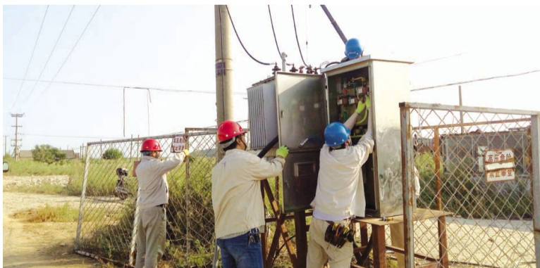
徐圩供电所致力于持续提升服务质量,满足客户需求。近日,德邦化工新厂破土施工,从该厂本月13日申请用电到用电设施安装到位,只用了3个工作日(该工程架设10KV线路300米、315KVA变压器、配电装置一套),服务质量得到了用户的充分肯定。(张伟)

一是利用好园区孵化器优势,大力发展市场化、专业化、集成化、网络化的“众创空间”,实现创新与创业、线上与线下、孵化与投资相结合,为小微创新创业企业和个人创业提供低成本、便利化、全要素的开放式综合服务平台。二是加大政策扶持,适应“众创空间”等新型孵化机构集中办公等特点,简化登记手续,为创业企业工商注册提供便利。支持有条件的地方对“众创空间”的房租、宽带网络、公共软件等给予适当补贴,或通过盘活闲置厂房等资源提供成本较低的场所。三是完善创业投融资机制。发挥政府创投引导基金和财税政策作用,对种子期、初创期科技型中小企业给予支持,培育发展天使投资。完善互联网股权众筹融资机制,发展区域性股权交易市场,鼓励金融机构开发科技融资担保、知识产权质押等产品和服务。四是打造良好创新创业生态环境。健全创业辅导指导制度,支持举办创业训练营、创新创业大赛等活动,培育创客文化,让创新创业蔚然成风。(韩挺)