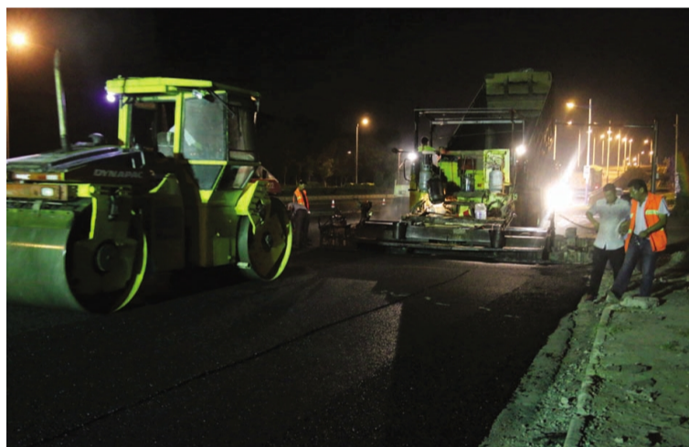
华茂盛达市政公司放弃中秋假日休息，加班加点，“挑灯夜战”，三天完成10000多平方米沥青路面摊铺维修任务，助力创卫，实现经济效益与社会效益双收益。图为中秋夜职工在港城大道马山立交桥东侧入口处作业现场摊铺沥青。

宣传发动，营造氛围。组织召开创卫工作推进会、创卫工作动员大会。充分利用电子显示屏、简报、网站、画廊、横幅加大创卫工作宣传力度，营造浓厚的创卫氛围。